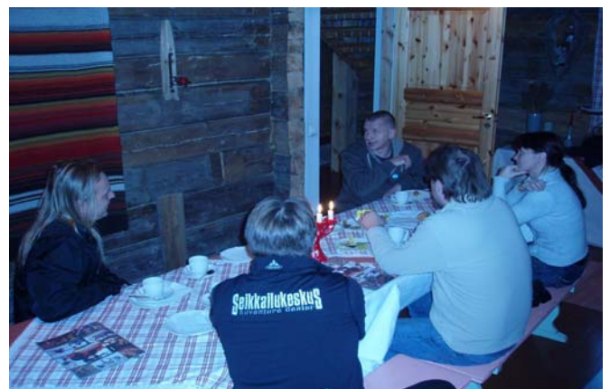
The entrepreneurs in joint study trip in Kuusamo.

Envolve – hankkeen myötä yhteistyö on vahvistunut etenkin luonto- ja matkailualan yrittäjien kanssa. Hankkeen pilotointi-yhteistyössä mukana olevien yritysten, Seikkailukeskuksen ja Nomad Experiences Ltd:n, kanssa yhteistyö on sisältänyt mm. työssäoppimisen ja tutkintojen arviointia, ammatillisen osaamisen kehittämistä (lyhytkoulutusten ja tutkintojen arviointikriteerien osalta), sekä rekrytointiyhteistyötä. (Katso lisää www.rekrychallenge.info . Yhteistyön lomassa osaamisvaatimukset ovat tarkentuneet puolin ja toisin. Pilotointi-yhteistyössä ovat mukana myös Halavatuun Papat / Ekvapoint Oy ja SeikkailuKuopio Oy.